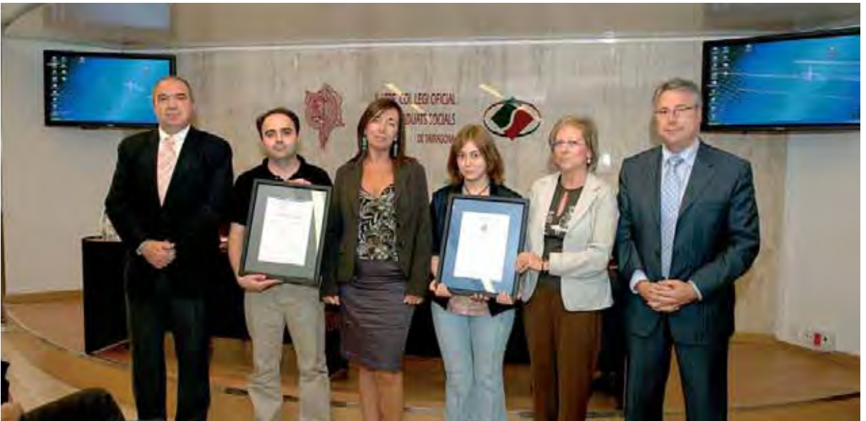
De izquierda a derecha: el director de AENOR en Cataluña junto a los empleados, la Gerente y el presidente del Colegio