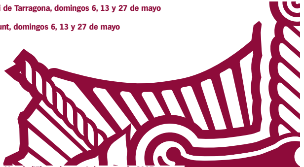
La Veu de l'Ebre, viernes 4 de mayo de 2007