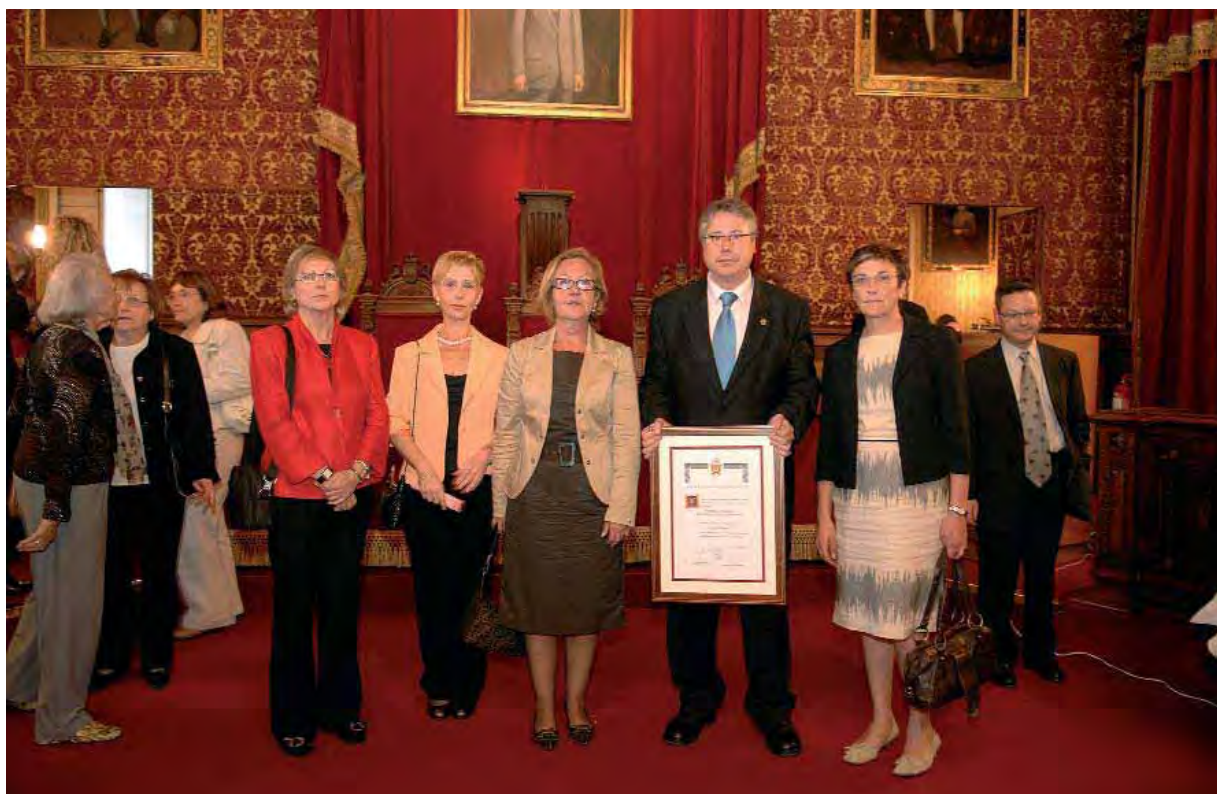
El presidente del Colegio muestra el Diploma recibido junto a tres miembros de la Junta y la Gerente del Colegio