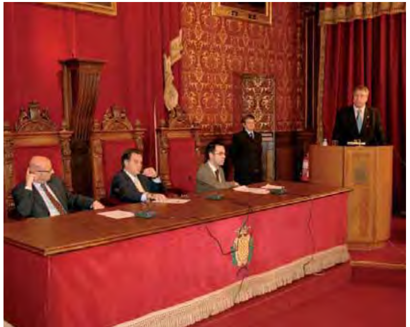
El acto oficial de entrega tuvo lugar en el Salón de Sesiones del Ayuntamiento

Por otra parte, la entidad mantiene una estrecha relación con la Universitat Rovira i