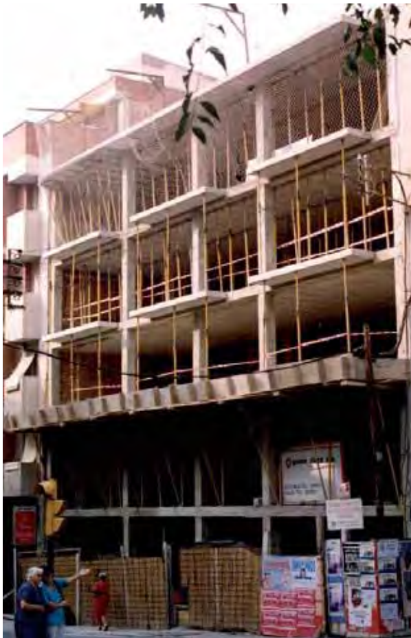
Imagen de la fachada en la calle Estanislau Figueres