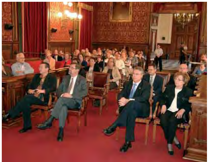
Diversos miembros de la Junta acompañaron al presidente del Colegio