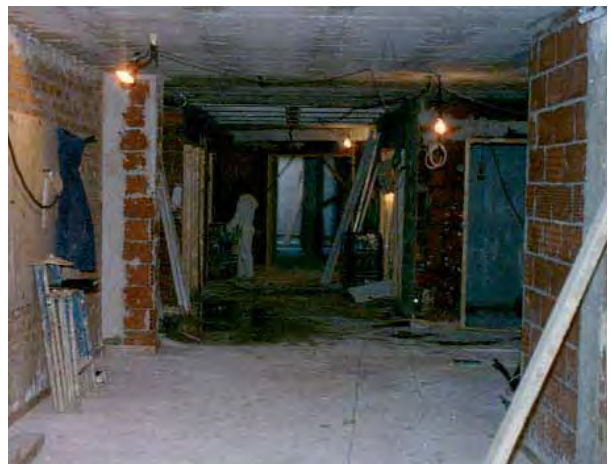
Fotografías que muestra la evolución de las obras de construcción