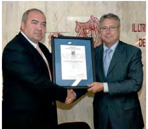
El director de AENOR en Cataluña entregó los certificados al Colegio

Hace tres años, el 29 de junio de 2004, nuestra entidad se convirtió en el primer colegio de Graduados Sociales de España en homologar sus actividades a la norma europea UNE-EN-ISO 9001/2000, cuando se le concedieron los cuatro Certificados de Calidad: el Certificado de Registro de Empresa ER-0910/2004 y el europeo IQNet ES-0910/2004 para sus actividades de Secretaría y el Certificado de Registro de Empresa ER-0911/2004 y el europeo IQNet ES-0911/2004 por las actividades de la Escuela de Práctica Profesional.