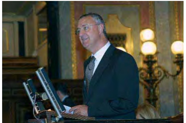
El ministro de Trabajo y Asuntos Sociales, Jesús Caldera

Se recogen también aspectos como la regulación de las posibilidades de jubilación anticipada, medidas dirigidas al fomento del empleo y de la cultura emprendedora, la formación profesional o medidas fiscales, entre otros.