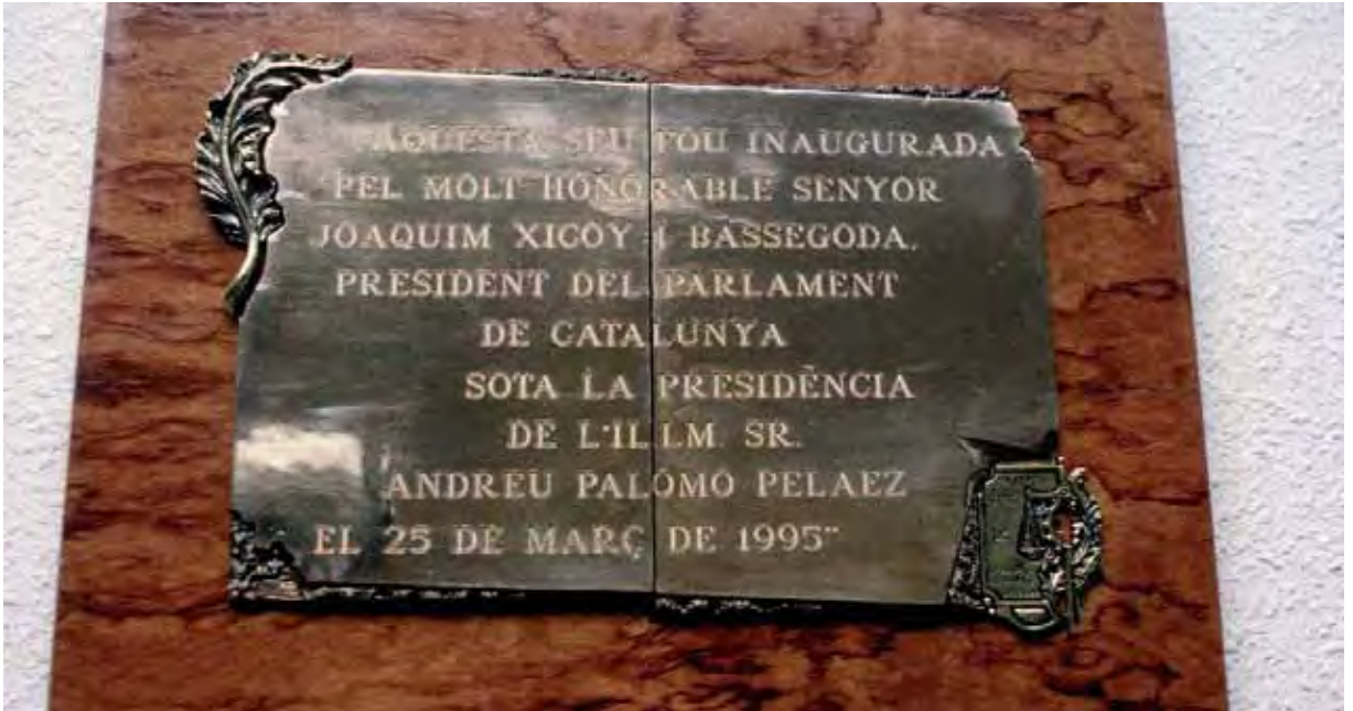
La placa conmemorativa de la inauguración de la sede en 1995