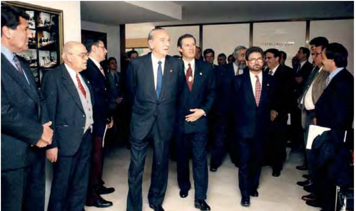
El acto de inauguración de la sede contó con la presencia del presidente del Parlament, Molt Hble. Sr. Joaquim Xicoy

Crileri sigue ofreciendo la sección 'Historia del Colegio' a través de la que queremos reflejar la historia y los hechos más destacados que han tenido lugar en nuestro Colegio a través de todos cuantos los han hecho posibles. Esta es una sección fija en esta revista que irá recordando la vida de nuestro Colegio, por eso, os animamos a colaborar con nosotros para elaborar esta historia con los datos, imágenes o anécdotas de los que podáis disponer.