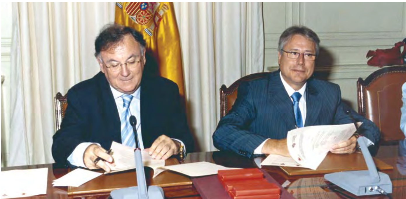
El Vicepresidente del CGPJ y el presidente del Colegio en el momento de la firma