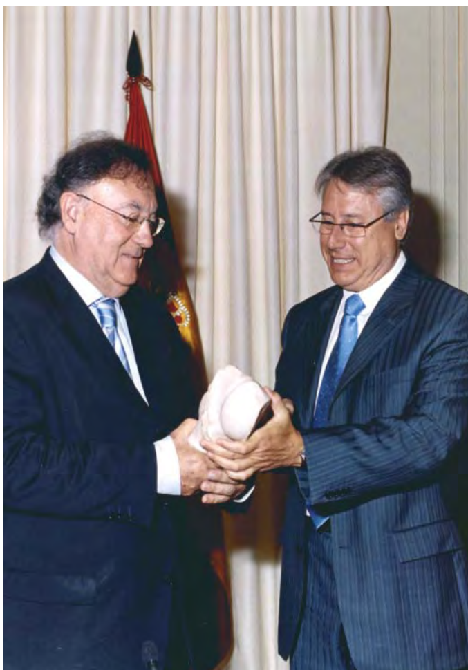
Intercambio de recuerdos