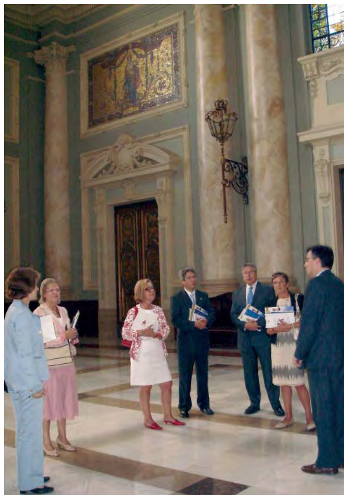
Los miembros de la Junta del Colegio durante la visita al Tribunal Supremo