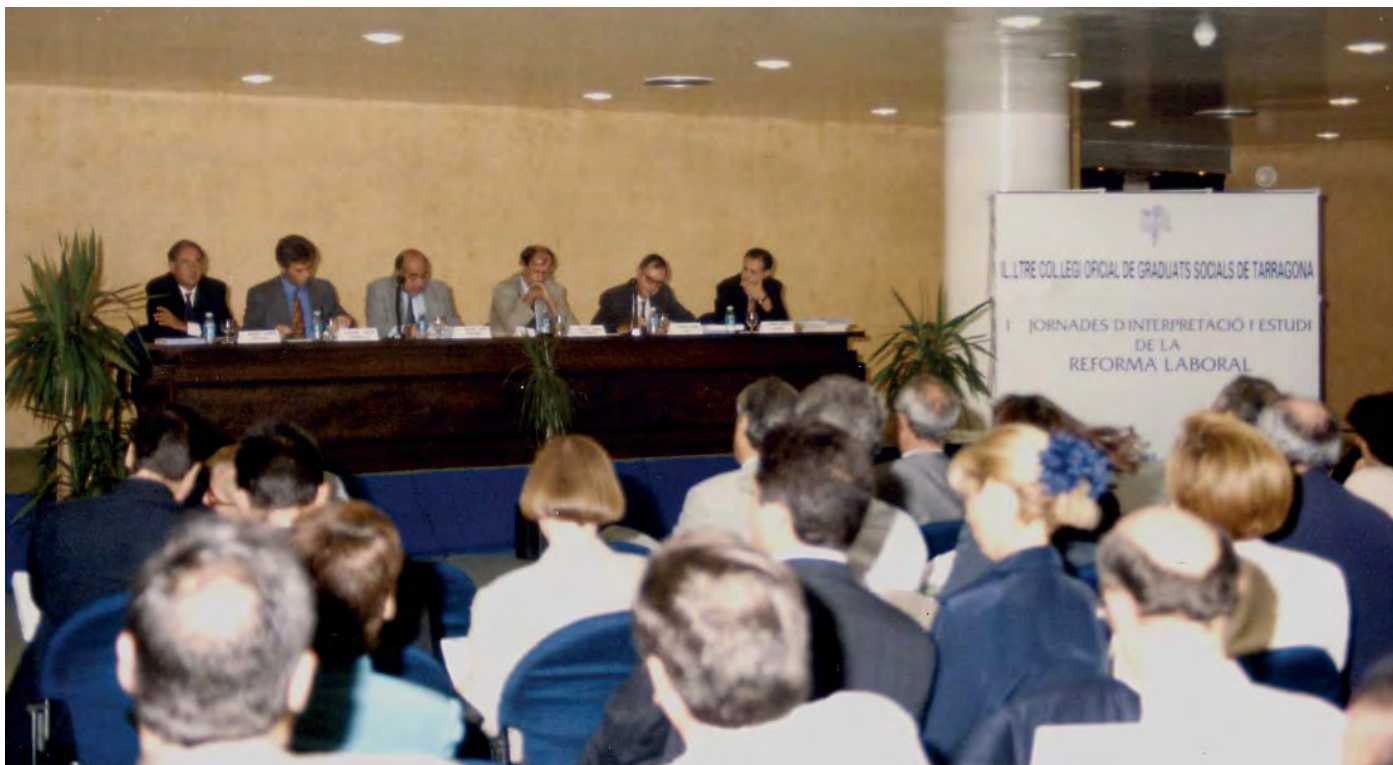
Un gran número de colegiados asistieron a la I edición de las Jornadas