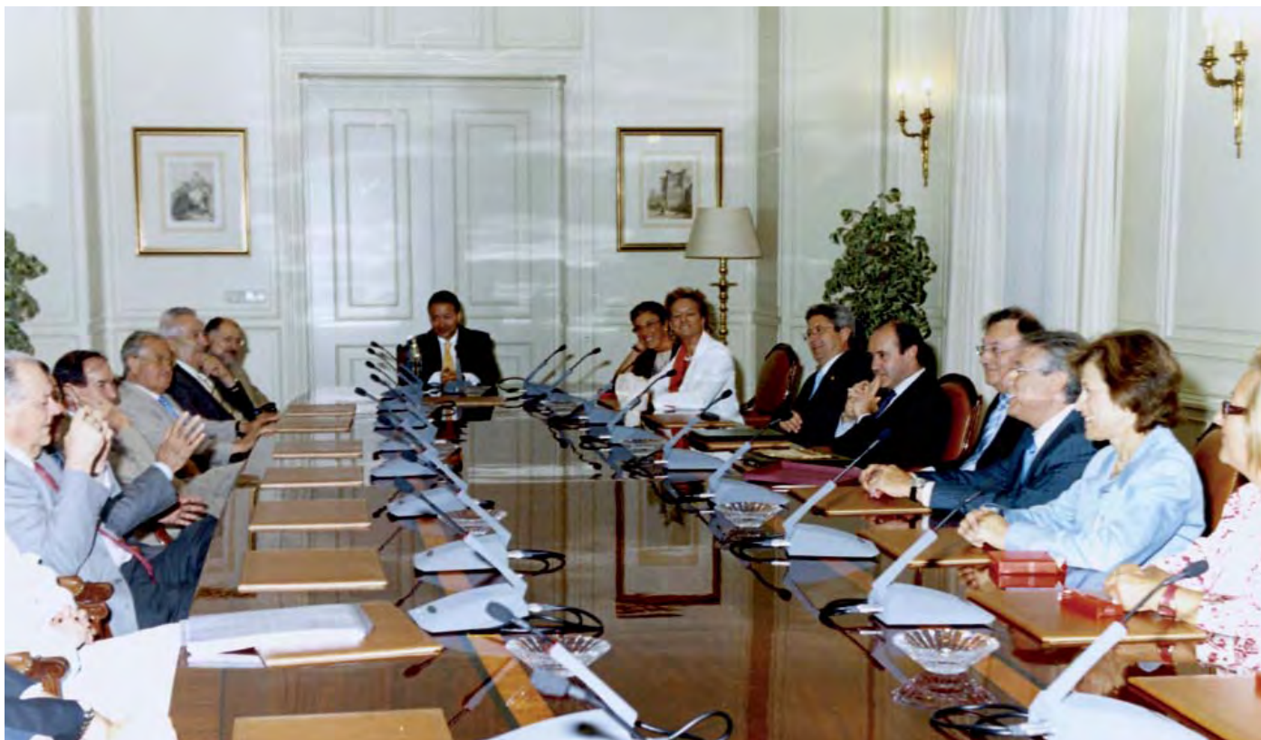
Imagen de algunos de los asistentes a la firma con el CGPJ