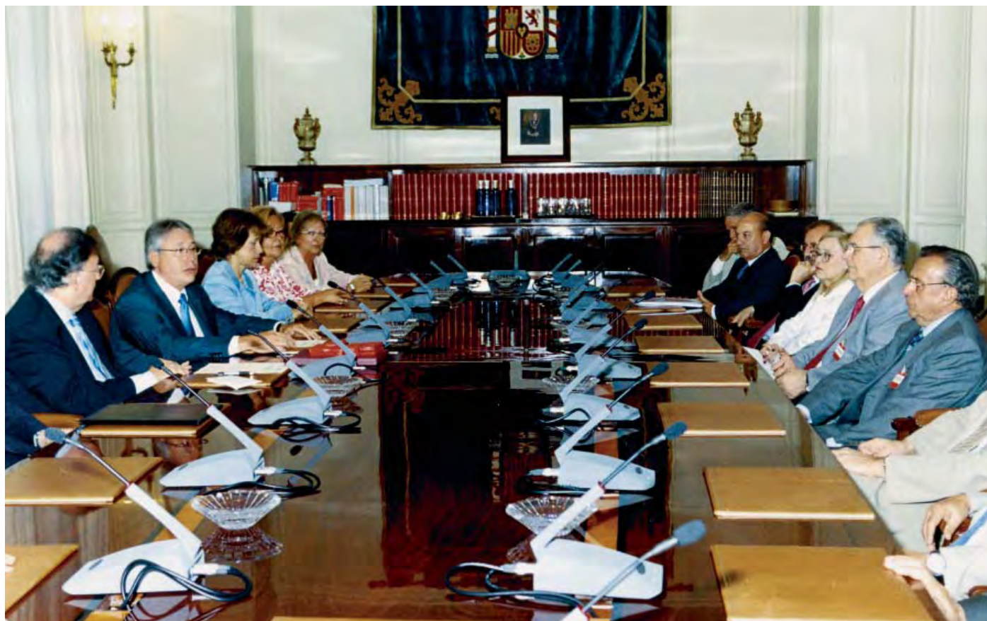
Asistieron a la firma del convenio diversos magistrados del Tribunal Supremo

El acuerdo firmado, que tiene carácter indefinido, contempla la elaboración anual de un plan de actuación conjunta de las