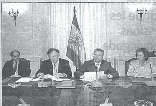
Un moment de l'acte celebrat a Madrid.