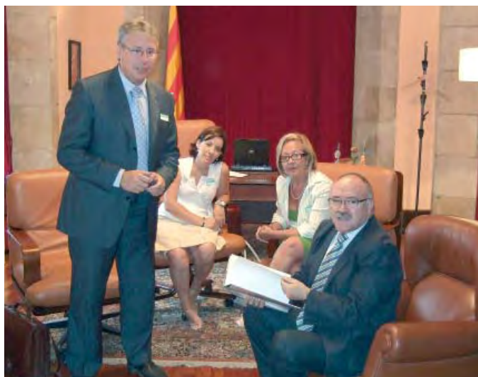
El conseller de la Vicepresidència va rebre a la representació del Col·legi

Les visites institucionals que realitza el Col·legi amb les diverses administracions, li permeten donar més fluïdesa als contactes que manté amb elles en diferents matèries.