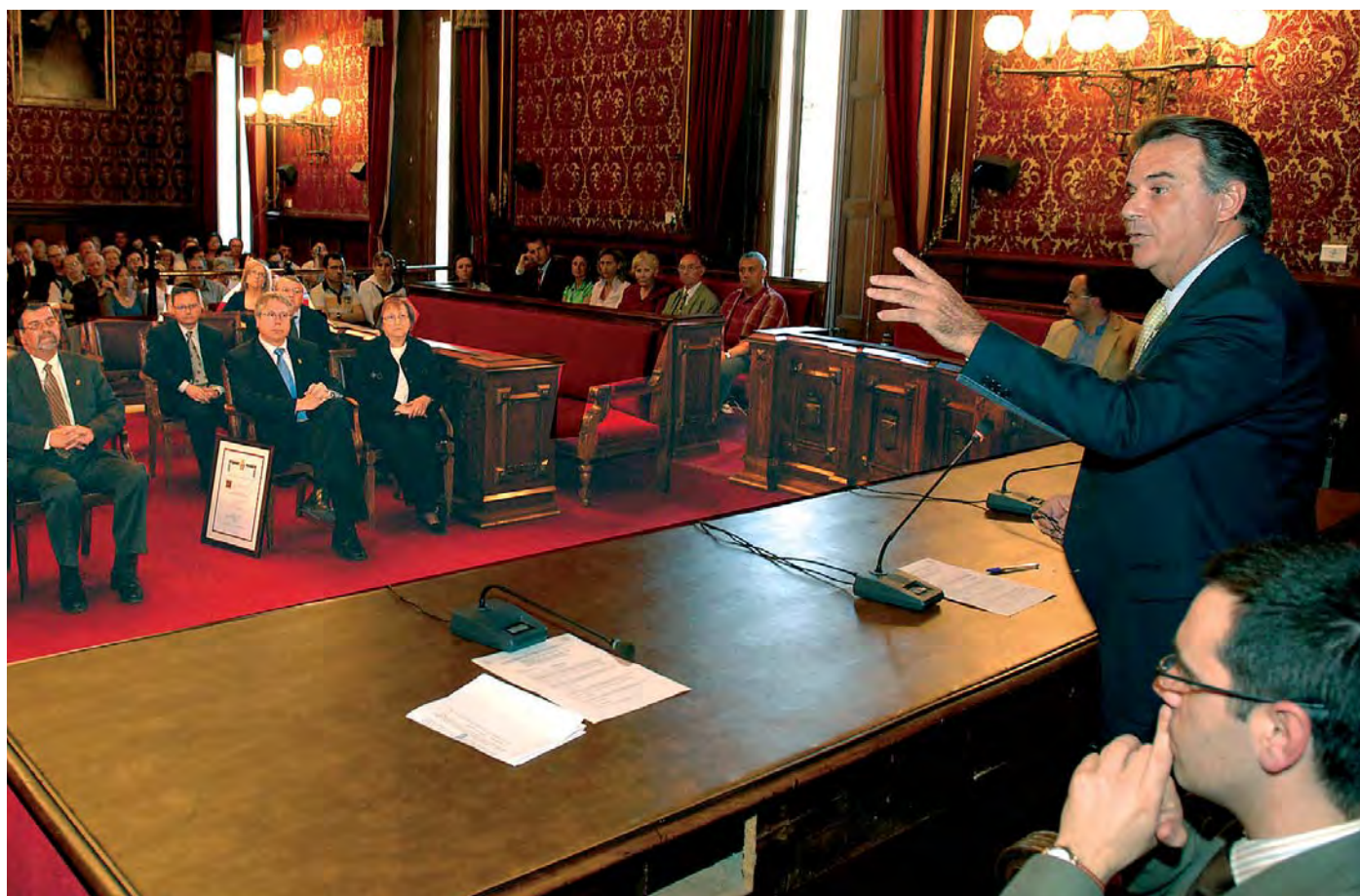
El nostre col·legi va rebre el diploma als Serveis Distingits a la Ciutat de Tarragona, el passat mes de maig, essent Alcalde de la ciutat Joan Miquel Nadal