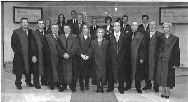
Una imatge dels nous membres del Col·legi de Graduats Socials de la ciutat de Tarragona durant aquest acte.

Aquesta entitat va celebrar l'acte d'imposició de togues