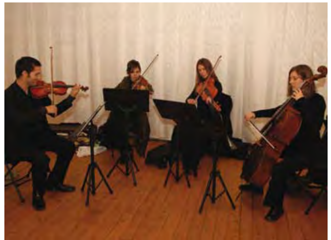
La Cena estuvo amenizada por el grupo musical "Quartet de Corda"