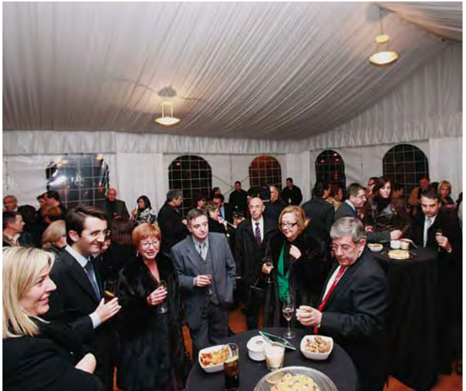
Antes de la celebración de la Cena tuvo lugar un aperitivo en una carpa instalada enfrente del Tinglado