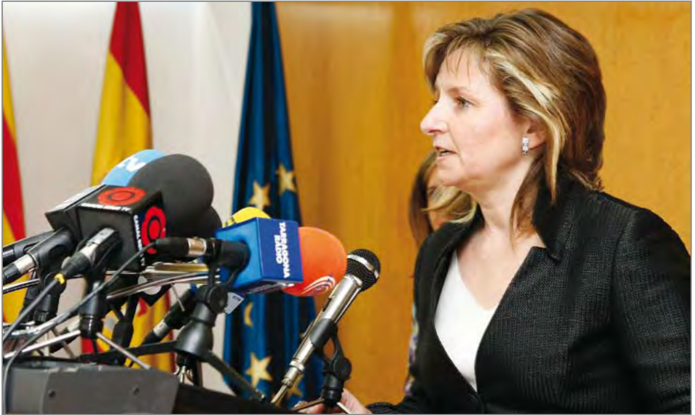
Pallarès es troba al capdavant de la Subdelegació del govern central a Tarragona des del mes de juny de l'any passat

I a la província de Tarragona, de 47.437 persones. Quina tendència creu que seguiran aquestes xifres de cara a aquest nou any que acabem d'encetar?