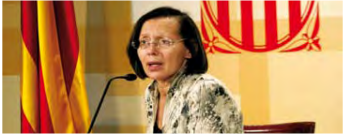
Montserrat Tura, consellera de Justícia

Pel que fa a la inversió en equipaments penitenciaris, anirà destinada a l'execució i licitació de les obres dels nous centres penitenciaris de dones a més de la licitació d'altres centres penitenciaris i centres de joves.