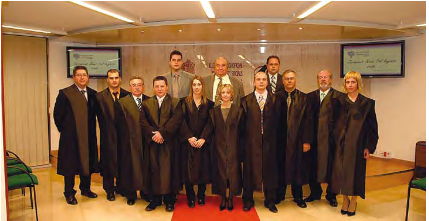
Editorial CISS hizo entrega de un obsequio a los nuevos colegiados ejercientes que prestaron juramento