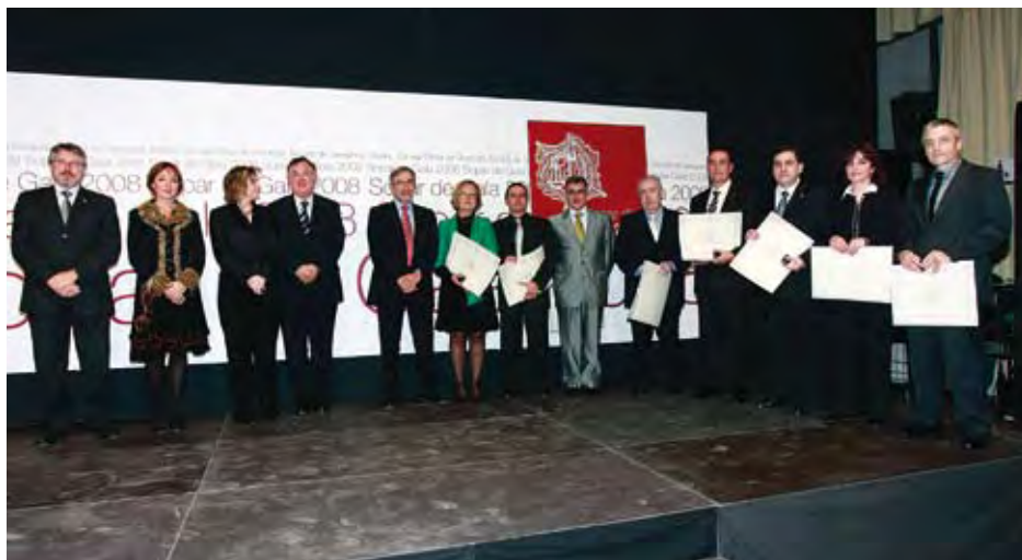
Foto de grupo de los colegiados distinguidos por su permanencia ininterrumpida en el Colegio durante 20 años