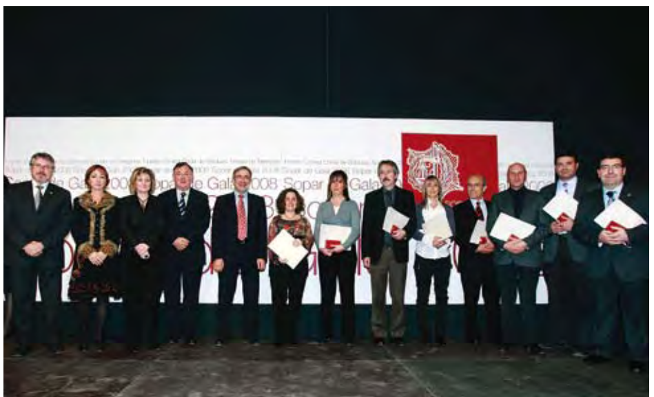
Foto de grupo de los colegiados que recibieron la Medalla al Mérito Profesional en la Categoría de Bronce