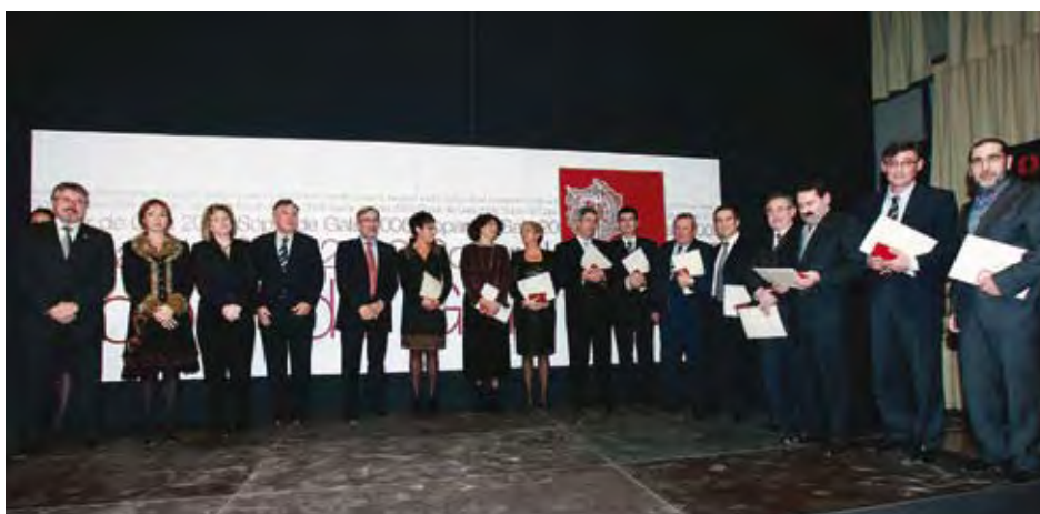
Este año, 11 colegiados recibieron la Medalla al Mérito Profesional en la Categoría de Plata