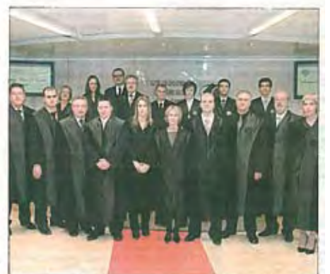
Les noves togues. L'il·lustre Col·legi de Graduats Socials de Tarragona va celebrar divendres l'acte d'imposició de togues i de jurament dels deu nous graduats socials exercents a la Seu del Col·legi.