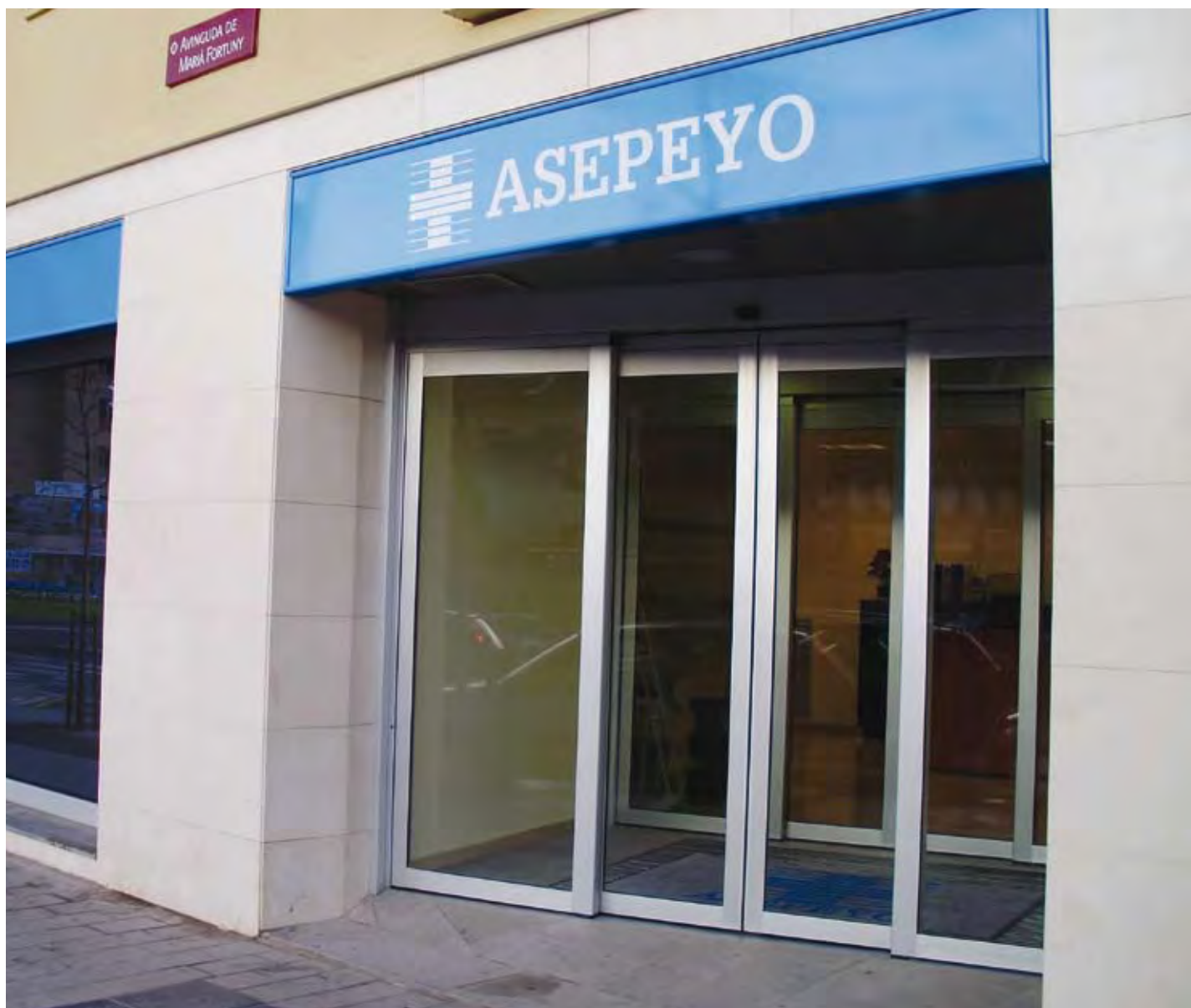
Imatge de la entrada del nou centre assistencial a Reus

Horari del centre: de dilluns a divendres de 8 a 20 h.