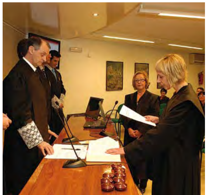
Diez Graduados Sociales realizaron su promesa en el acto del Juramento e Imposición de Togas