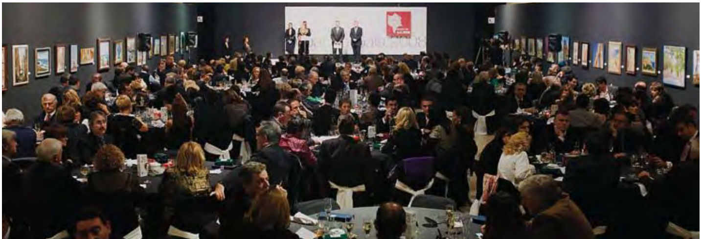
El Tinglado núm. 1 fue la sede escogida para la celebración de la Cena de Gala