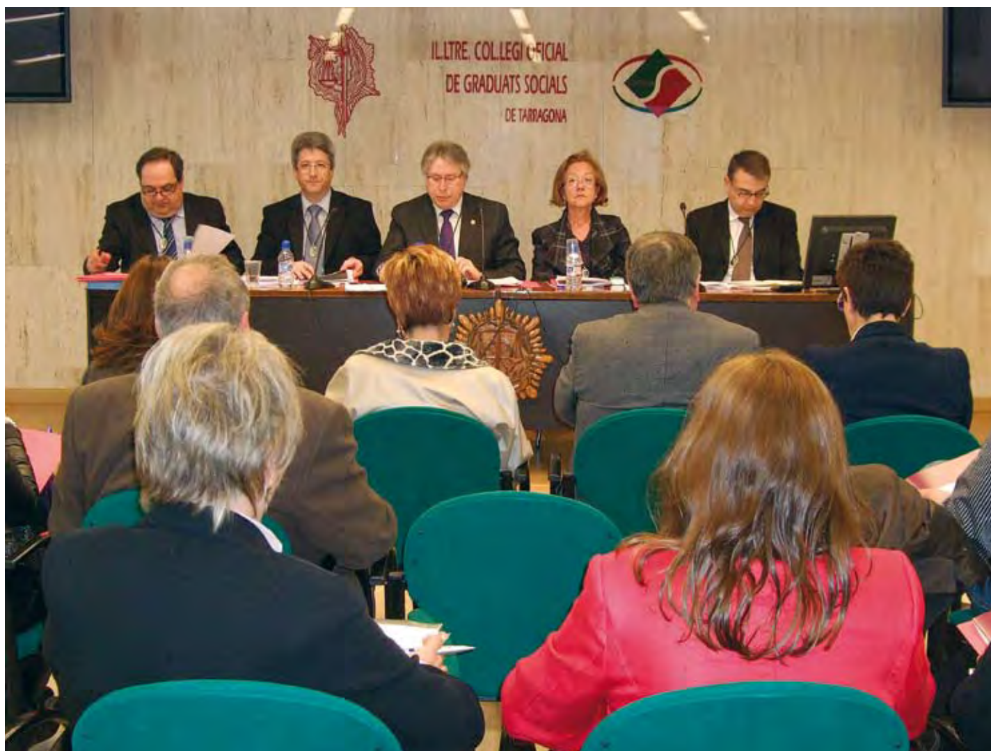
La Junta General Ordinària va aprovar per unanimitat tots els punts de l'ordre del dia