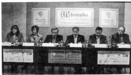
Una de les taules de treball de les jornades organitzades Fany pasat

La sala d'actes de la Ciutat de Repòs i de Vacances de Tarragona acull el diàleg 4 i 5 de març les Jornades de Dret del Treball i de Seguretat que organitza per quinze anys consecutius el Col·legi Oficial de Graduats Socials d'aquesta demarcació. Amb la delicada situació econòmica i social actual com a referent, les jornades, que comptaran amb la participació de dotze ponents experts en les matèries que s'exposaran i que aplegaran graduats socials i professionals del dret del treball de tot l'Estat, s'organitzen en tres grans blocs sota la temàtica de l'actualitat laboral en la jurisdicció social.