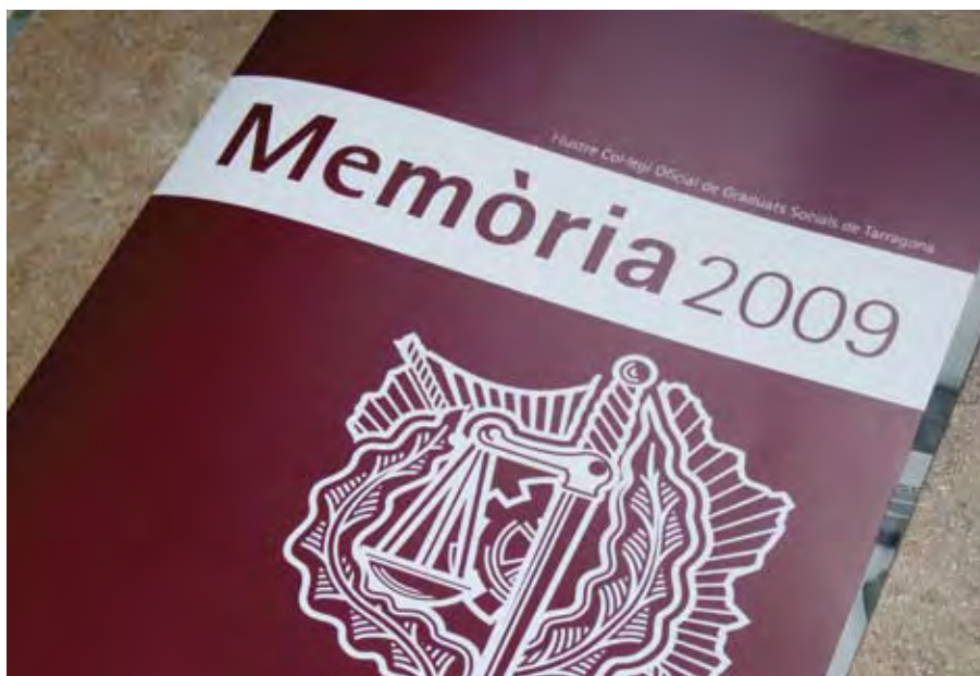
La Memòria Anual Col·legial de l'any 2009

Per últim, els membres de la Junta General també van donar compte i posterior aprovació del Balanç d'Ingressos i Despeses del Col·legi corresponents a l'exercici 2009, així com del pressupost previst per al present any 2010.