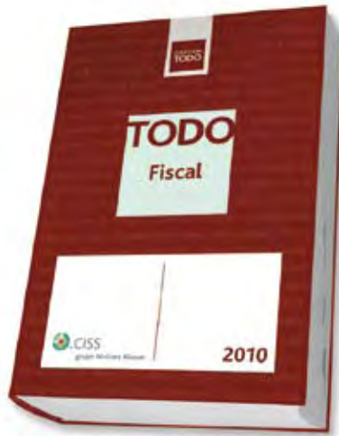
TODO FISCAL 2010

Autores: José Manuel Cabrera Fernández, María Cabrera Herrero