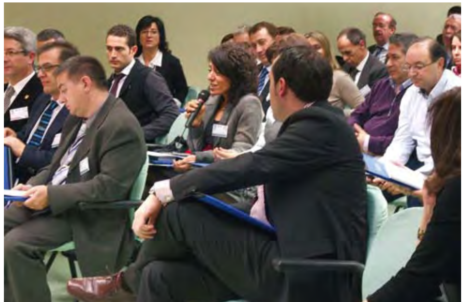
El numeroso público asistente tomó parte activa de las XV Jornadas durante los diferentes coloquios