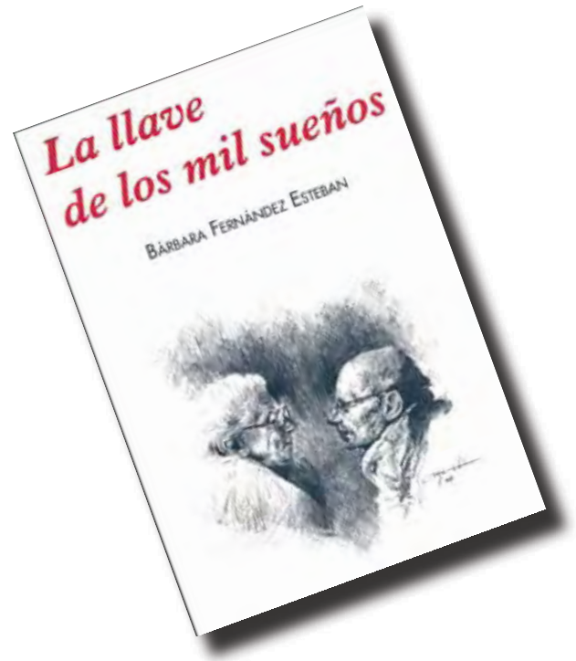
Imatge de la portada de la novel·la escrita per la nostra col·legiada

L'autora d'aquest llibre, editat per Silva Editorial, és natural de Terol, tot i que ja fa molts anys que viu i treballa a l'àmbit tarragoní. Va estudiar Peritatge Industrial, a més de Dret, coneixements que ha exercit en el món laboral durant una extensa trajectòria, fet que li ha valgut el reconeixement del col·lectiu dels Graduats Socials, doncs l'any 2007 va obtenir la Medalla al Mèrit en el Treball, en la categoria d'or, per la seva permanència ininterrompuda al nostre col·legi durant 20 anys.