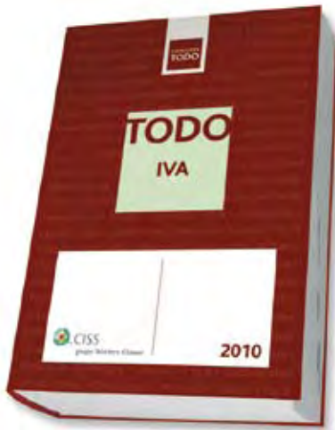
TODO IVA 2010

Guía muy práctica para gestionar el impuesto del valor añadido, en formato de anuario. La obra les ofrece respuestas claras y fundamentadas para resolver cuantas dudas le surjan en la gestión tributaria de este impuesto. La edición 2010 incorpora los cambios más recientes, tanto en el marco nacional como el de las Comunidades Autónomas, de un impuesto en constante evolución desde su implantación en 1986, complementándose con la más novedosa doctrina de la Dirección General de Tributos y de los distintos Tribunales, donde hay que destacar las Sentencias del Tribunal de Justicia de las Comunidades Europeas, que armonizan la interpretación normativa de un Impuesto común en los distintos Estados miembros. Está estructurada en XIII capítulos en los que se exponen todos los aspectos del Impuesto. Incluye: Comentarios sobre el funcionamiento del impuesto. Ejemplos de aplicación y casuística. Fundamentación normativa, administrativa y jurisprudencial. Llamadas de atención en los aspectos más importantes o en las novedades más recientes. Una completa guía de los modelos tributarios con sus características. Supuestos prácticos. Cuadros resumen con las modificaciones en la Ley y el Reglamento del impuesto, los periodos de vigencia y las disposiciones administrativas relacionadas.