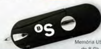
Memòria USB de 8 Gb

Ara, a més a més, només pel fet de fer-se client, aconseguirà un regal ben pràctic .