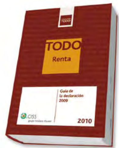
TODO RENTA 2010