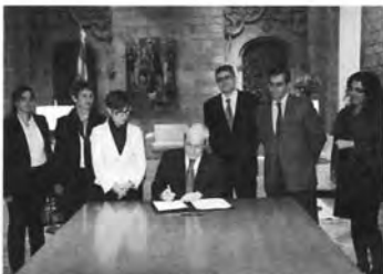
Montilla, ahir, signant el decret de traspàs.