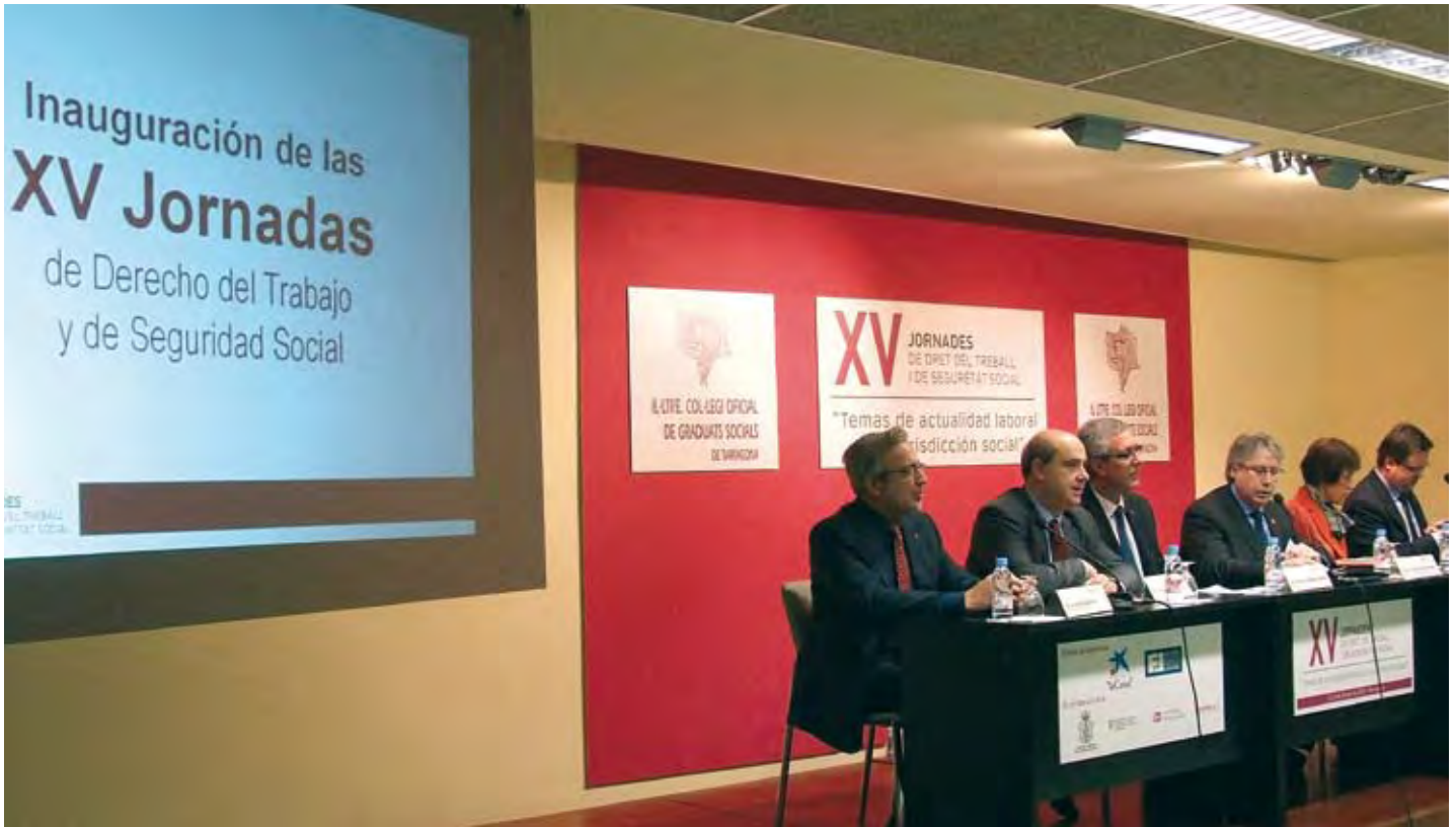
La XV edición de las Jornadas se celebró nuevamente en la Ciutat Residencial de Repòs i Vacances, reuniendo por segundo año consecutivo a un total de 12 ponentes de reconocido prestigio y trayectoria