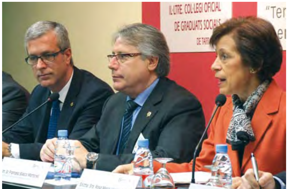
El alcalde de Tarragona, Ilmo. Sr. Josep Fèlix Ballesteros, presidió el acto inaugural de las XV Jornadas

Finalmente, el último turno de conferencias del primer panel correspondió a la ponencia titulada "El difícil equilibrio entre el poder de dirección del empresario y los derechos de los trabajadores derivados de la Maternidad" , una exposición pronunciada por la Excm. Sra. María Luisa Segoviano Astaburuaga , Magistrada de la Sala Cuarta del Tribunal Supremo. La ponente realizó un extenso e interesante repaso a la jurisprudencia más reciente en la materia tratada, basándose en la STC 003/2007 y en el recurso 897/2007, que consiguieron elevar todavía más el grado de interés y atención de la sala, tal y como quedó demostrado al finalizar esta última