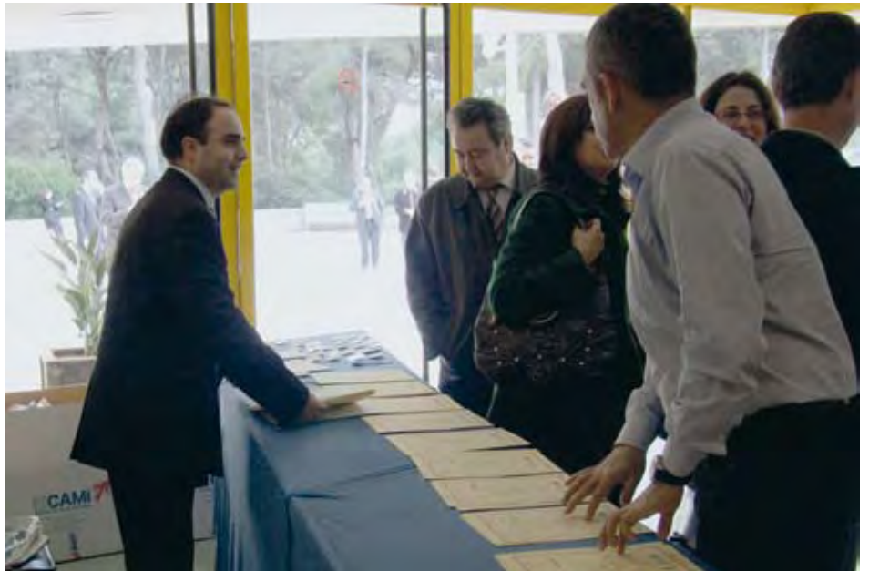
Los asistentes a las Jornadas recibieron el pertinente diploma acreditativo