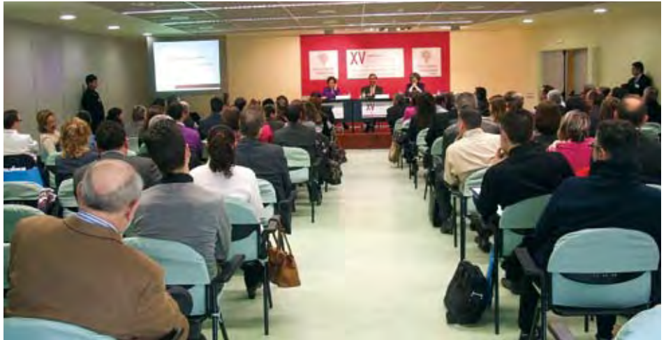
Las Jornadas se estructuraron en tres paneles temáticos