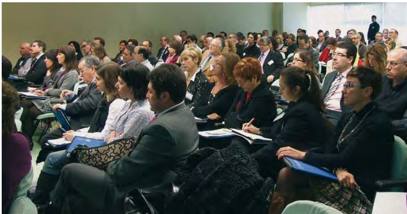
Un año más, la elevada asistencia de público fue la tónica dominante

Finalizado el coloquio se reprendió la sesión con la última conferencia, titulada "Análisis de las últimas reformas procesales laborales" , pronunciada por el Excmo. Sr. Gonzalo Moliner Tamborero, Presidente de la Sala Cuarta del Tribunal Supremo. Tras su intervención, y sin pausa, él mismo fue el encargado de clausurar las XV Jornadas.