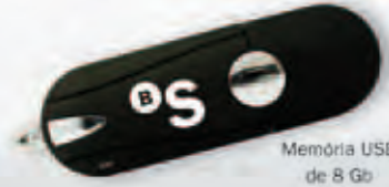
Memòria USB de 8 Gb

Ara, a més a més, només pel fet de fer-se client, aconseguirà un regal ben pràctic .