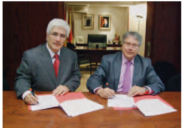
El Cap de Zona de Catalunya de Sage Lògic Control i el nostre President, durant la signatura de la renovació del conveni de col·laboració