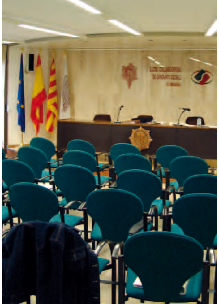
La nostra seu col·legial veurà millorades les seves instal·lacions amb l'adquisició de noves pantalles per facilitar el seguiment de cursos i seminaris

I pel que fa a la pàgina web, actualment s'està treballant en la construcció d'un nou portal, actuació que s'està compaginant amb les actualitzacions diàries a la pàgina actual. Un cop enllestida aquesta nova pàgina web, suposarà una renovació completa, tant en el disseny, que serà més actual, com en el contingut, més pràctic i còmode d'utilitzar.