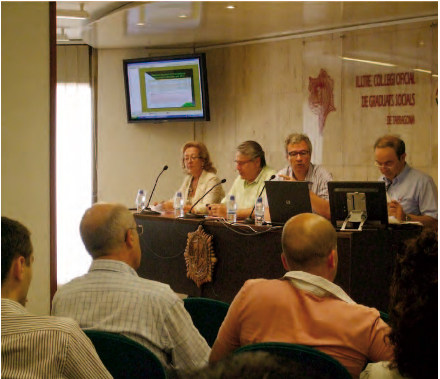
Un instant de la sessió informativa, que va abordar qüestions com l'article 132 Quatre de la Llei 39/2010