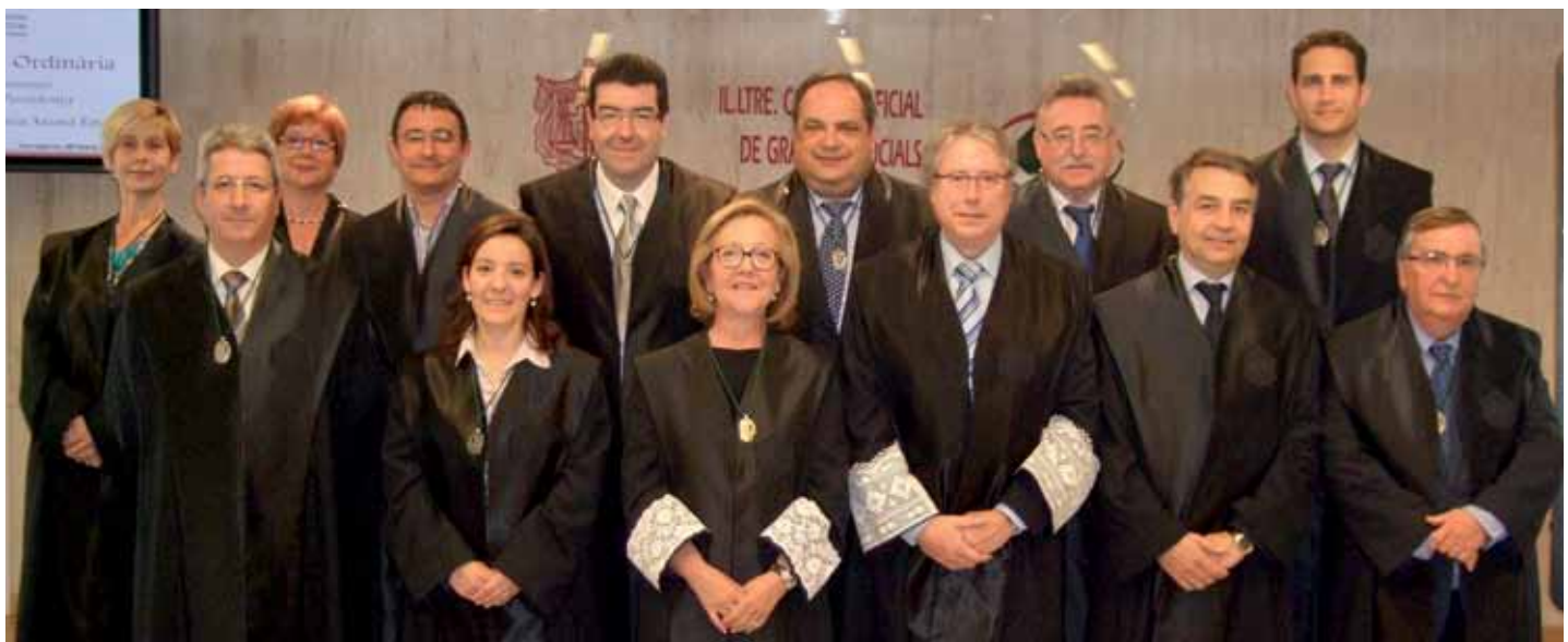
La composició de la nova Junta de Govern del Col·legi, amb la seva nova presidenta al centre, acompanyada del seu antecessor en el càrrec