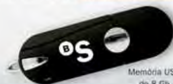
Memòria USB de 8 Gb

Ara, a més a més, només pel fet de fer-se client, aconseguirà un regal ben pràctic .