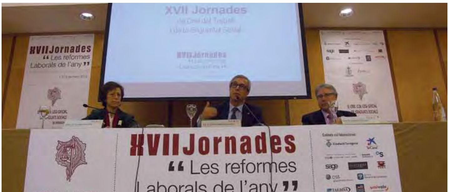
En la imagen superior, un instante de la inauguración de las XVII Jornadas. Debajo, la clausura con el alcalde de Tarragona