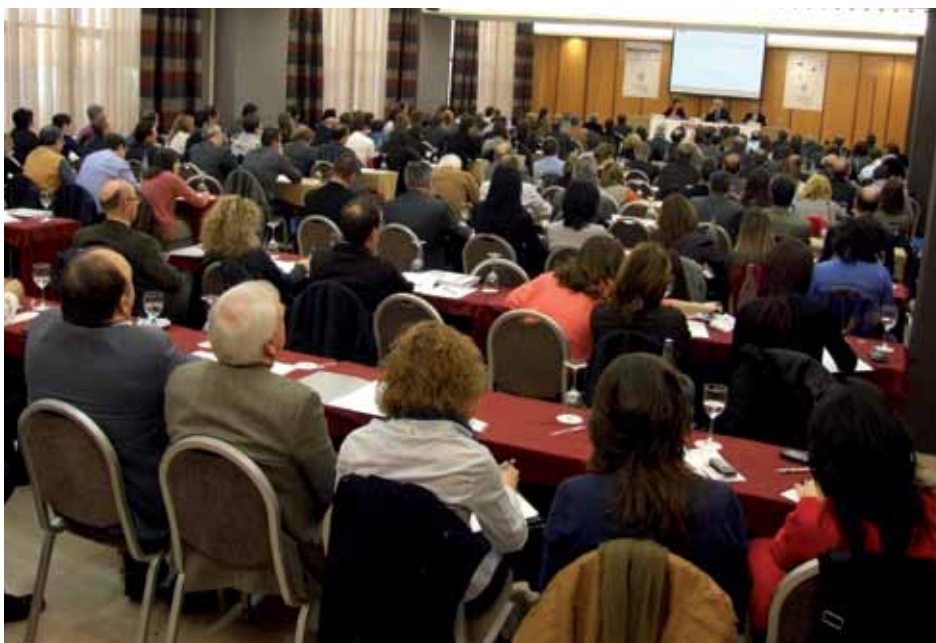
Más de 270 asistentes dejaron pequeña la gran sala del Hotel Ciutat de Tarragona

A continuación y tras un nuevo coloquio llegó el turno de la última conferencia del jueves,