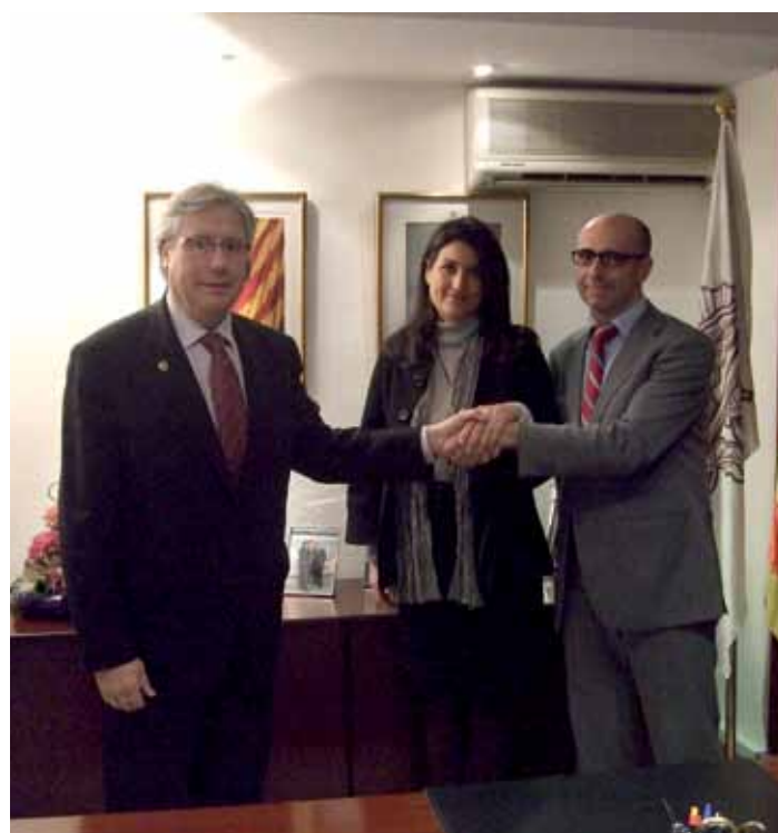
Dos instants de la signatura del conveni entre el nostre Col·legi i Umivale