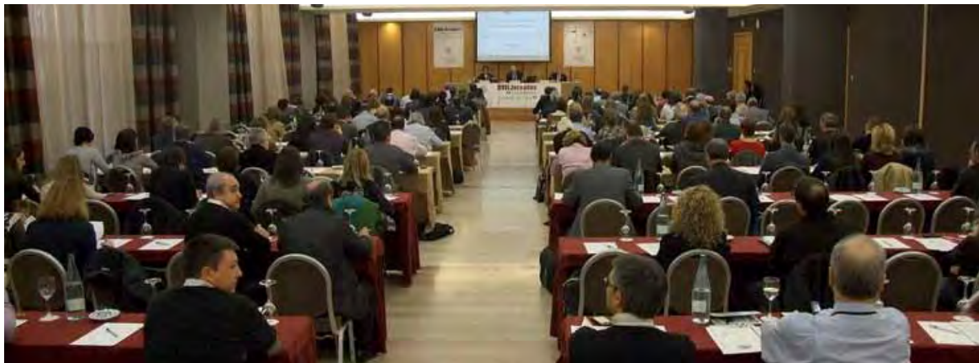
Durante dos días, el 8 y 9 de marzo, las XVII Jornadas ofrecieron ocho ponencias de máximo interés y actualidad en relación a la Reforma Laboral