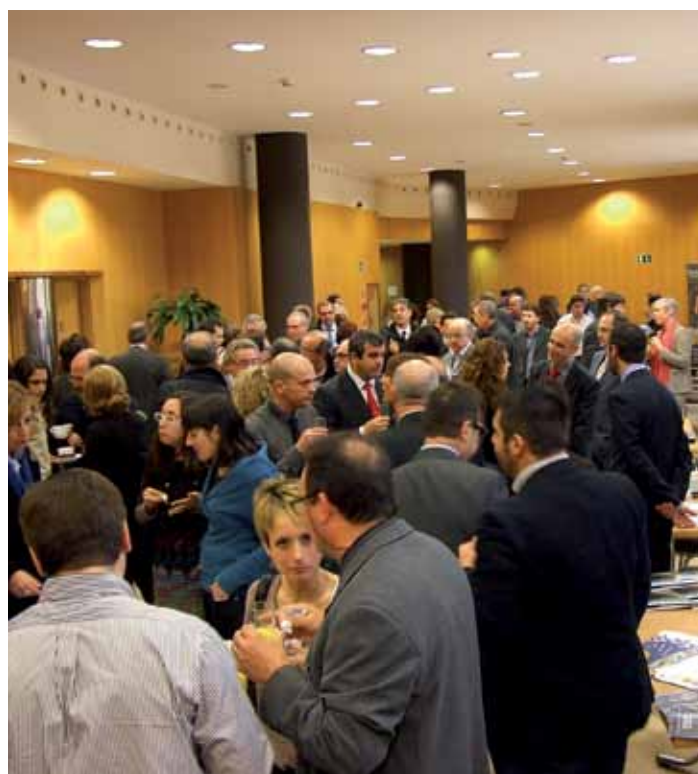
Tras cada ponencia se abrió un turno de debate de lo más participativo. A la derecha, una pausa para reponer fuerzas