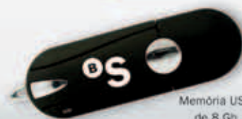
Memòria USB de 8 Gb

Ara, a més a més, només pel fet de fer-se client, aconseguirà un regal ben pràctic .