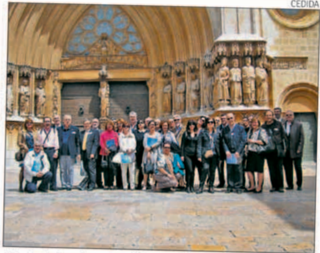
Estudiants i professors van fer una visita guiada per Tarragona.

presentació retrospectiva del món laboral a les primeres civilitzacions i l'evolució dels estudis de Graduats Socials. També es va fer entrega de diplomes de reconeixement als professors, a la Facultat de Ciències Jurídiques i a l'Ajuntament pel recolzament a la trobada. L'acte va finalitzar amb una actuació del Cor Al-leluia. Després van fer una visita guiada per Tarragona. La jornada va finalitzar amb un dinar de germanor. Redacció