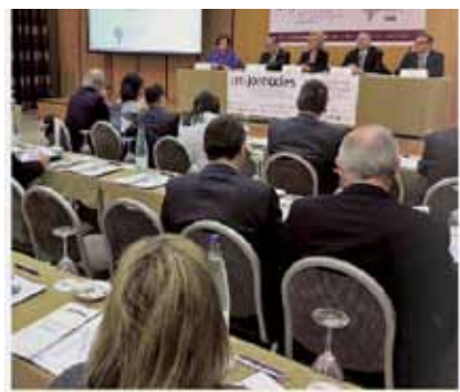
Tornen les Jornades de Dret del Treball. Tarragona acull fins avui la 21a edició de les Jornades de Dret del Treball i de Seguretat Social, amb més de 200 ponents i unes 200...