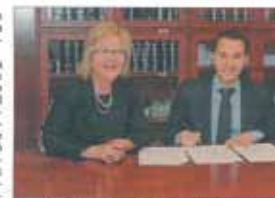
Moment de la signatura del conveni entre el Col·legi Professional de Graduats Socials de Tarragona i Mas Carandell. El Regidor d'Ocupació al Camp de Tarragona, a més, destaca que el conveni amb el Col·legi professional impulsa el desenvolupament del territori i la formació i ocupació a la ciutat.