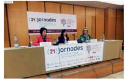
Finalitzen les 21 Jornades de Dret del Treball i de Seguretat Social de Tarragona. El Col·legi de Graduats Socials de Tarragona celebró la vigésima de les Jornades de Dret del Treball i de Seguretat Social, en les quals sessions formatives sobre temes de actualitat al voltant de est...