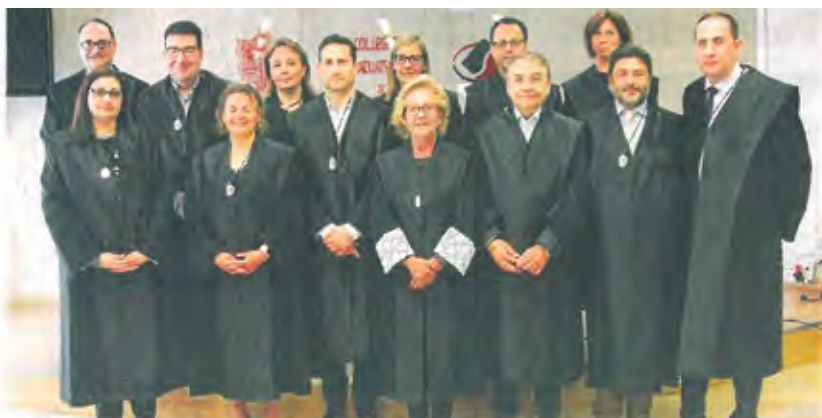
Los nuevos miembros han tomado posesión del cargo tras ser elegido a través de una votación.