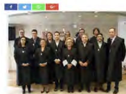
(Durant la Junta celebrada el dia 10 de maig, es van incorporar sis nous exercients i una vocal no exercient)