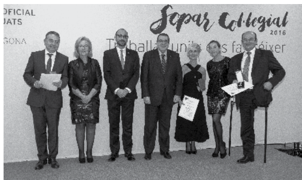
Els Col·legiats Exercents que van recollir personalment la Medalla Corporativa al Mèrit en el Treball en la Categoria de Plata, per 25 anys de col·legiació ininterrompuda.

Els Col·legiats Exercents que van recollir personalment la Medalla Corporativa al Mèrit en el Treball en la Categoria d'Or, per 20 anys de col·legiació exercent.