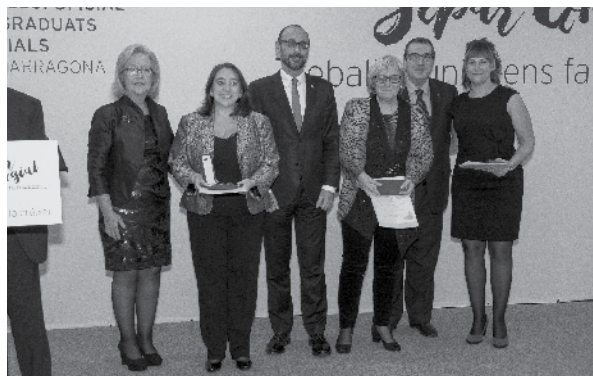
Fotografia dels col·legiats que van recollir la Medalla de Sant Josep Artesà al Mèrit Professional en la Categoria de Bronze

Medalla de Sant Josep Artesà al Mèrit Professional, en la Categoria de Bronze, per la seva permanència ininterrompuda en el Col·legi durant 15 anys, als següents Col·legiats: