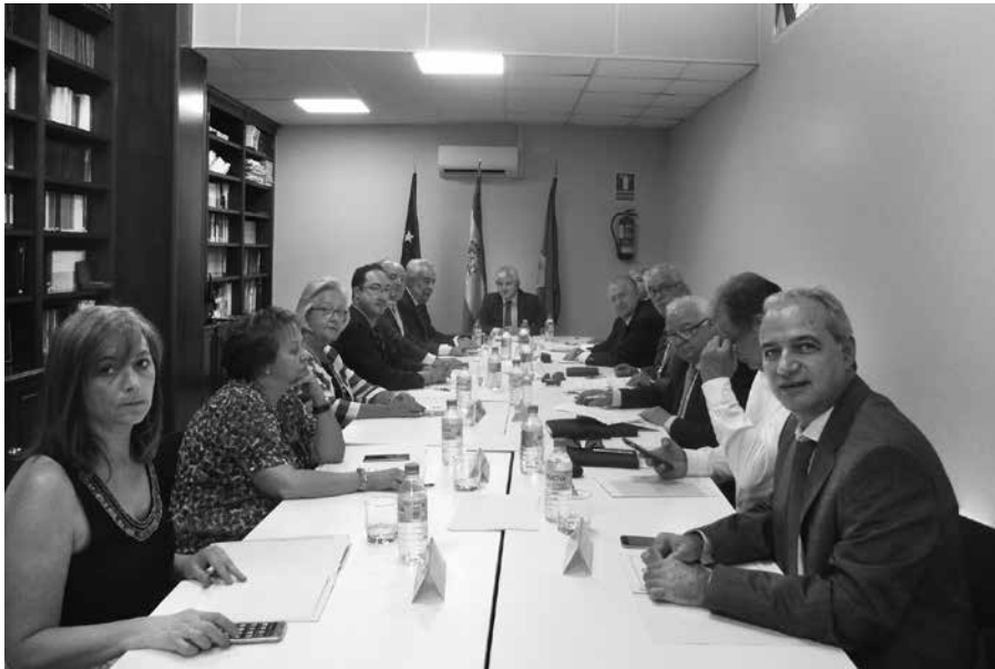
Fotografia de la reunió del Ple dels Presidents Autònoms de Col·legis Oficial de Graduats Socials, celebrada el dia 27 de juny, a la Seu del Consejo