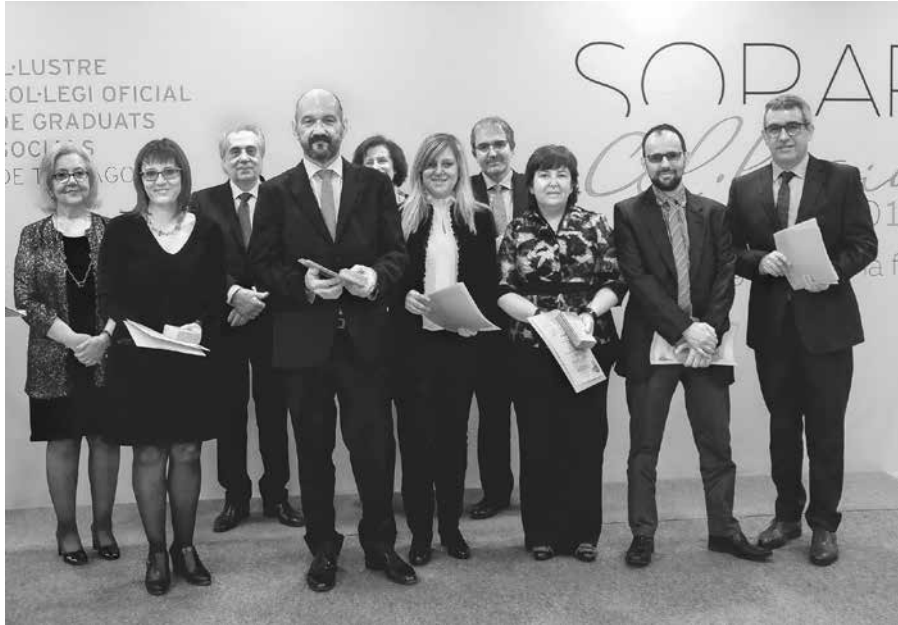
Fotografia dels col·legiats que van recollir la Medalla de Sant Josep Artesà al Mèrit Professional en la Categoria de Bronze

Medalla Corporativa al Mèrit en el Treball, en la Categoria d'Or, per la seva permanència ininterrompuda al Col·legi, com a Col·legiats Exercents, durant 20 anys, als següents Col·legiats: