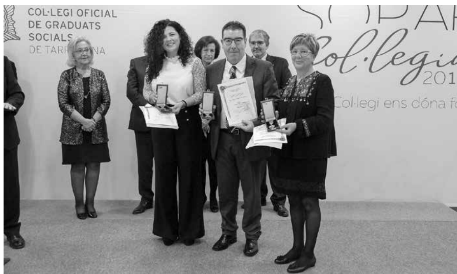
Fotografia de grup dels col·legiats recollint la Medalla de Sant Josep Artesà al Mèrit Professional, en la Categoria de Plata, per haver estat membre de la Junta de Govern.