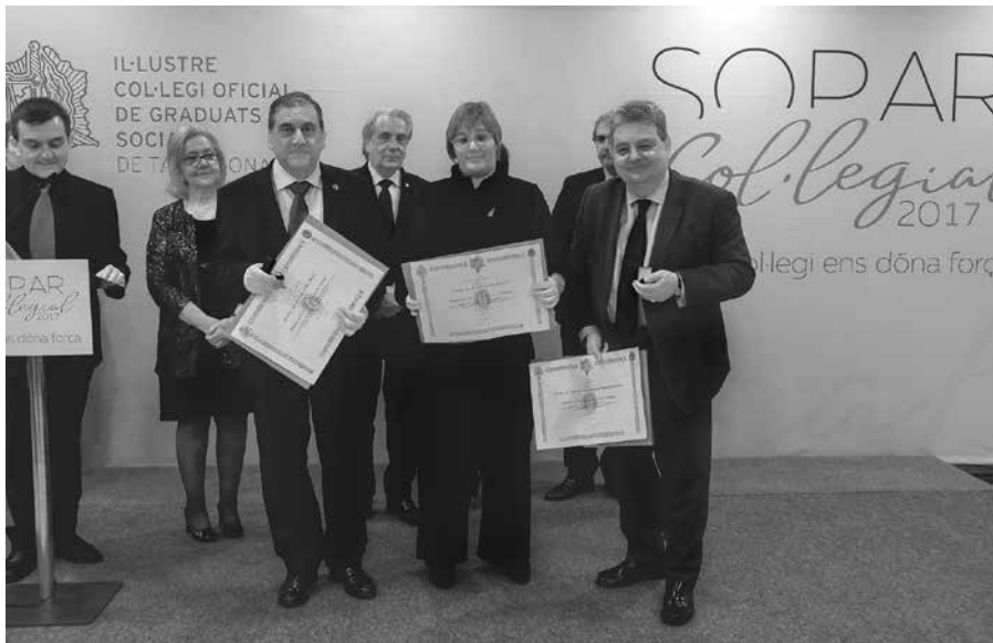
Els Col·legiats Exercents que van recollir personalment la Medalla Corporativa al Mèrit en el Treball en la Categoria d'Or, per 20 anys de col·legiació exercent.

Medalla de Sant Josep Artesà al Mèrit Professional, en la Categoria de Plata, per la seva permanència ininterrompuda al Col·legi durant 25 anys, als següents Col·legiats: