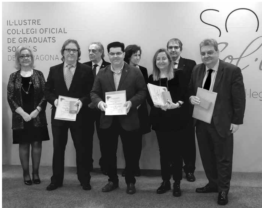
Medalla de Sant Josep Artesà al Mèrit Professional en la Categoria de Plata, pels seus 25 anys de col·legiació ininterrompuda

Distinció, per la seva permanència ininterrompuda al Col·legi durant 30 anys, als següents Col·legiats: