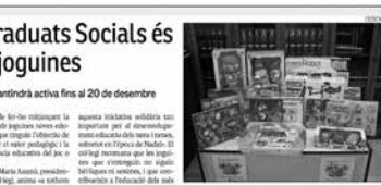
Joguines de les joguines que ja han arribat a la seu del Col·legi.

El Col·legi de Graduats Socials de Tarragona col·labora amb Creu Roja en la campanya de recollida de joguines. La campanya es mantindrà activa fins al 20 de desembre. La campanya es mantindrà activa fins al 20 de desembre.