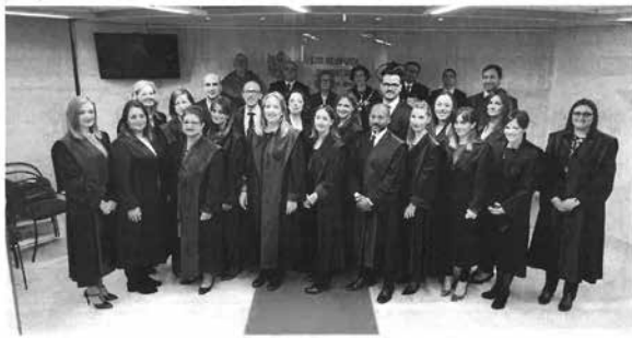
La velada comptà amb uns 250 invitats, entre col·legiats, membres d'empreses i autoritats.