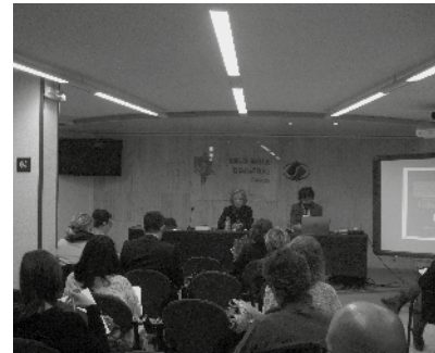
EPP Gràfica 9