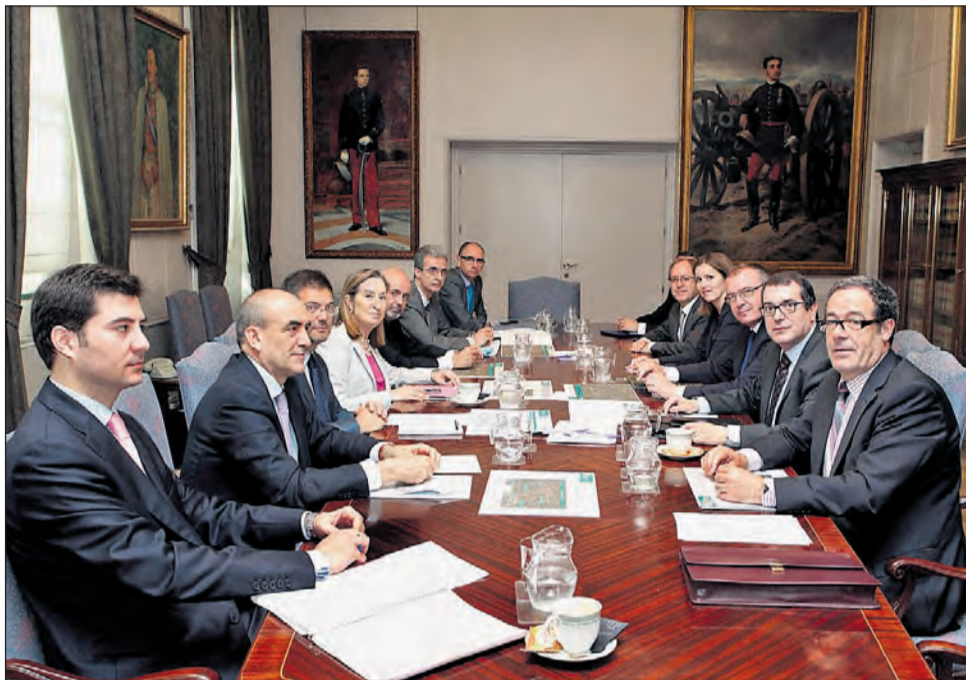
La reunió entre els representants de Reus i la ministra de Foment, Ana Pastor.

Segons Tarrés, la ràpida reacció de Foment i la reunió «per parlar en detall del projecte», han aturat, «de moment», la possibilitat de presentar el recurs.