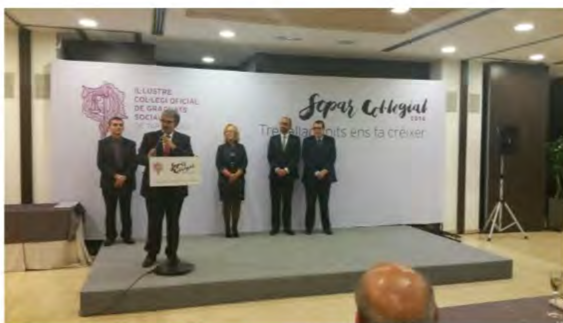
Il·lustració: El Col·legi de Graduats Socials de Tarragona va celebrar ahir al vespre, una nova edició del seu Sopar Col·legial. L'acte va reunir prop de 300 persones, entre graduats socials i els seus familiars, així com autoritats, agents socials i econòmics, membres d'altres col·legis professionals i representants d'entitats col·laboradores. «Treballar units ens fa créixer», aquest va ser el lema entorn al qual va girar aquest sopar que s'ha convertit amb els anys, en un important punt de trobada per al sector. A més, en el marc d'aquest sopar anual, també es lliuren diverses distincions amb les que es pretén reconèixer la tasca desenvolupada i la trajectòria dels col·legiats d'aquesta institució.